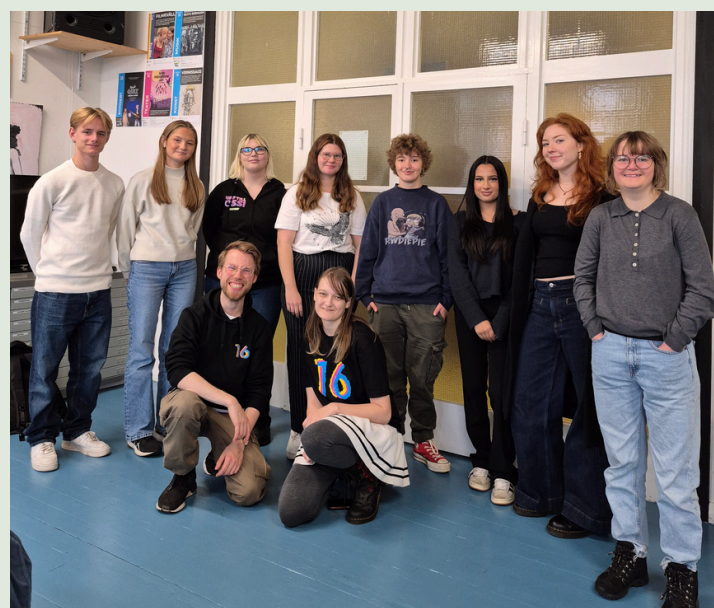
Ovan: Bilder från verksamhet och projekt under 2025.