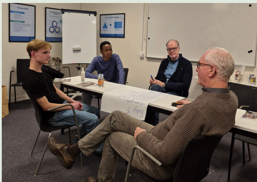
Ovan: Bilder från verksamhet och projekt under 2025.